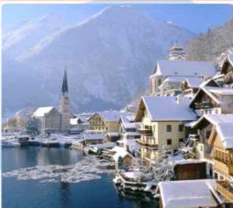
ออสเตรียบาวาเรียดินแดนแห่งเทพนิยาย