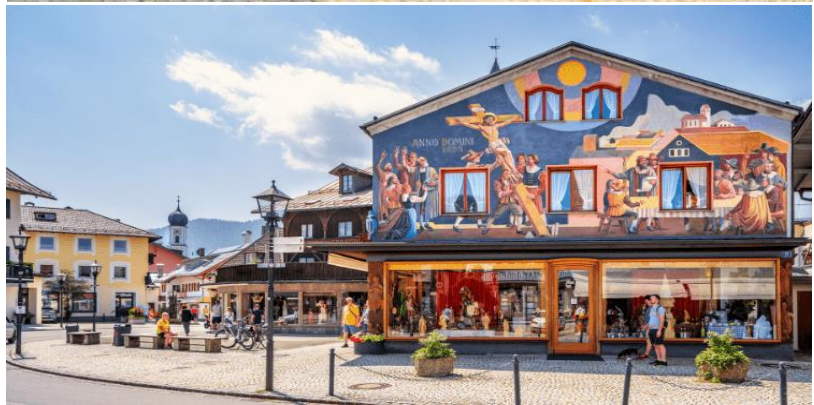
เมืองขนาดเล็กบริเวณพรมแดนติดกับประเทศออสเตรีย ของขึ้นชื่อของที่นี่คืองานแกะสลักไม้และภาพเขียนเฟสโก ที่มีเนื้อหาเกี่ยวกับศาสนาคริสต์ ภาพเขียนเหล่านี้ถูกวาดลงบนผนัง