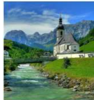
ออสเตรียบาวาเรียดินแดน แห่งเทพนิยาย

ออสเตรีย – บาวาเรีย (Austria-Bavaria) ดินแดนวัฒนธรรมเก่าแก่ที่ครอบคลุมสองประเทศและแทบแยกกันไม่ออกเลยที่เราเที่ยวอยู่ในออสเตรียหรือเยอรมัน ท่านจะประทับใจไปกับหมู่บ้านเล็กๆน่ารัก ที่ตั้งอยู่บริเวณริมทะเลสาบในเทือกเขา “เยอรมัน-ออสเตรียแอลป์” พร้อมบริการอาหารรสเลิศและที่พักอย่างดีระดับ 4 ดาว หรูหราที่เราคัดสรรมาให้ท่านได้พักผ่อนอย่างเต็มที่ให้การเดินทางของท่านคุ้มค่าที่สุดได้ในเส้นทางที่สวยงามที่สุดของออสเตรีย-บาวาเรีย