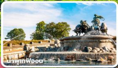
น้ำพุเฟออบ