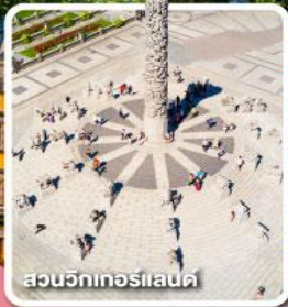
สวนจิกเกอร์แลนด์