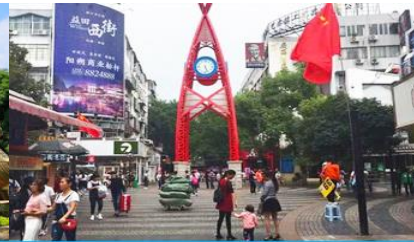
ถนนคนเดิน เจิ้งหยางอู่