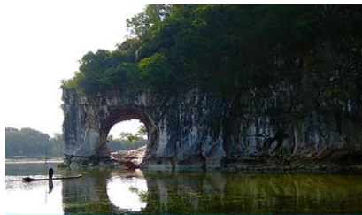
เขาวงว้าง

พักที่ GUILIN JINYI HOLIDAY HOTEL โรงแรมระดับ 4 ดาวท้องถิ่น หรือเทียบเท่าในเมืองกุ้ยหลิน