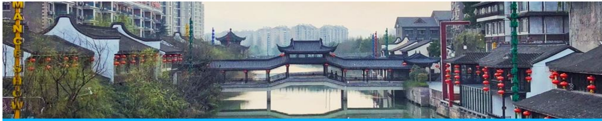
เมืองชวงจำลอง

พักที่ GUILIN JINYI HOLIDAY HOTEL โรงแรมระดับ 4 ดาวท้องถิ่น หรือเทียบเท่าในเมืองกุ้ยหลิน