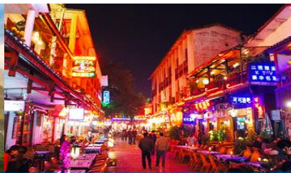
ถนนคนเดิน ซิเคียวหรือถนนฟร้ง

วันที่สอง เมืองกุ้ยหลิน – ศูนย์จำหน่ายผลิตภัณฑ์หยก- เลือกซื้อโปรแกรมเสริมเมืองลับแล- เมืองหยางซัว – ล่องเรือแพแม่น้ำหลี่เจียง-กระเช้าขึ้นเขาหุ้ยฟ่ง – หยางซัว- ถนนฝรั่ง