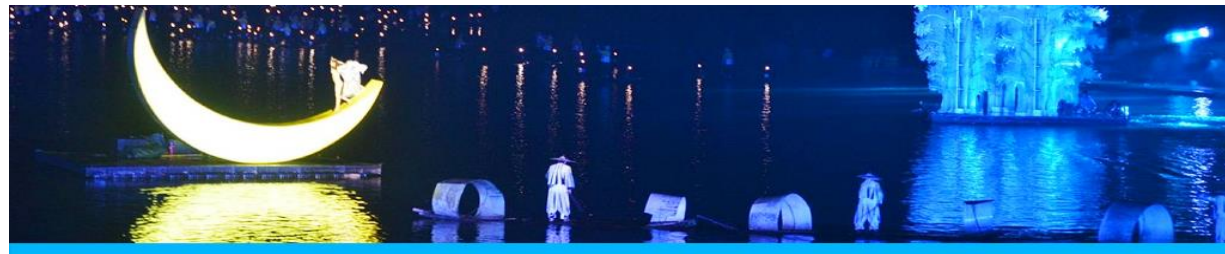
The Impression of Liu Shan Jie