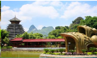
สวนหลิวซานเจีย