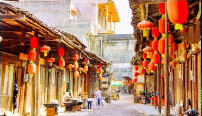
เมืองโบราณต้าชวี

อัตราค่าบริการสำหรับโปรแกรมเสริมการแสดงชุด The Impression of Liu san jie ท่านละ 380 หยวน ระยะเวลาที่ใช้ในการเที่ยวชมการแสดง ประมาณ 2 ชั่วโมง ครึ่ง รวมเวลาเดินทางไป กลับ ค่าบริการรวม ค่าบัตรเข้าชม ค่ารถรับ ส่ง และค่าน้ำเที่ยวของไกด์ท้องถิ่น พักที่ HAO YUAN INTER HOTEL ระดับ 4 ดาวท้องถิ่นหรือเทียบเท่าใน เมืองหยางซั่ว