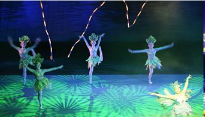
โชว์ DREAM LIKE LIJIANG