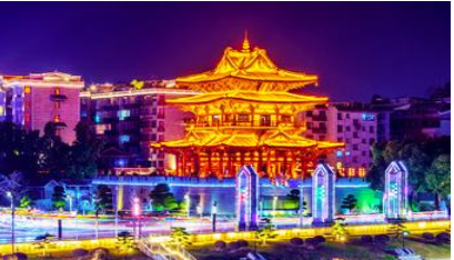
หอเซียวเหยาโหลว

วันที่สาม เมืองหยางซั่ว-เมืองโบราณต้าชวี -เขาฝูปัว- ศูนย์แพทย์แผนจีน-โชว์ Drem Like Lijiang – หอเซียวเหยาโหลว – ช้อปปิ้งย่าน ดงซี เชียง