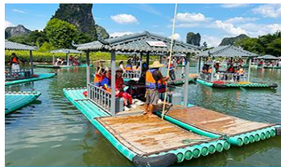
ขึ้นเรือแพชมแม่น้ำหลี่เจียง