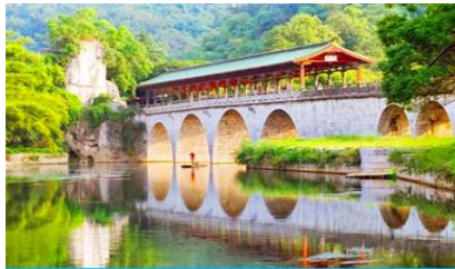
สวนเจ็ดดาว

พักที่ GUILIN JINYI HOLIDAY HOTEL โรงแรมระดับ 4 ดาวห้องดีน หรือเทียบเท่าในเมืองกุ้ยหลิน