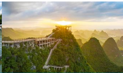
ภูเขาหุ้ยฟ่ง