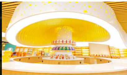
พิพิธภัณฑดอกกุ้ยฮวา