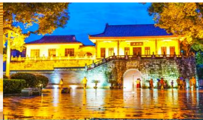
ประตูโบราณกุ๋หนานเหมิน

วันที่ เมืองกุ้ยหลิน –เขาวงว้าง – ร้านผลิตผ้าไหม – พิพิธภัณฑดอกกุ้ยฮวา –ประตูโบราณกุ๋หนานเหมิน-ต้นไทรพันปี- เมืองกุ้ยหลิน