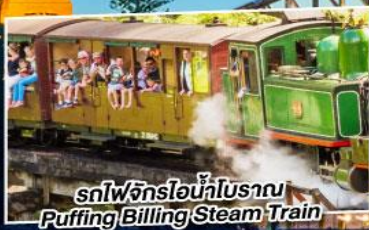
รถไฟจักรไอน้ำโบราณ Puffing Billong Steam Train