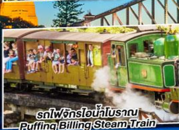
รถไฟจักรไอน้ำโบราณ Puffing Billing Steam Train