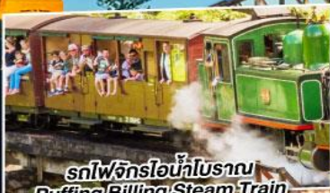
รถไฟจักรไอน้ำโบราณ Puffing Billong Steam Train