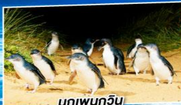
นกเพนกวิน