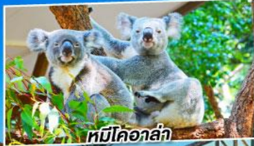
หมีโคอาล่า