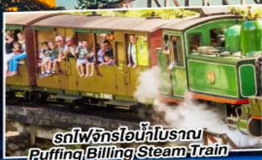
รถไฟจักรไอน้ำโบราณ Puffing Billing Steam Train