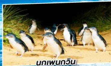
นกเพนกวิน