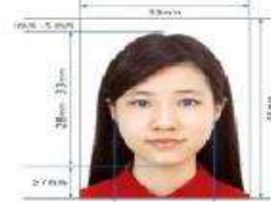
Paper Photo for Visa Application Form