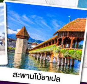
สะพานไม้ชาเปลา