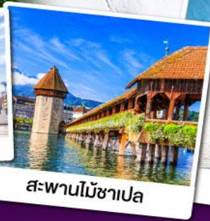
สะพานไม้ชาเปลา