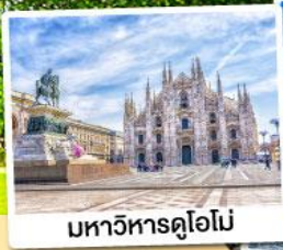
มหาวิหารดูโอโม

09-15 พ.ย. 67 28 ม.ค.-03 ก.พ. 68 12-18 มี.ค. / 11-17 เม.ย. 68 07-13 พ.ค. 68