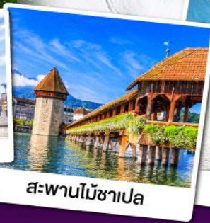
สะพานไม้ชาเปลา