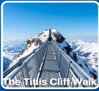
The Titlis Cliff Walk