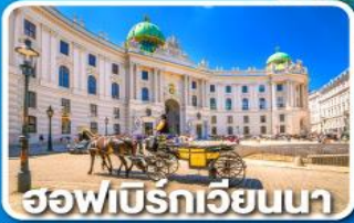
ฮอเฟิลเบิร์กเวียนนา