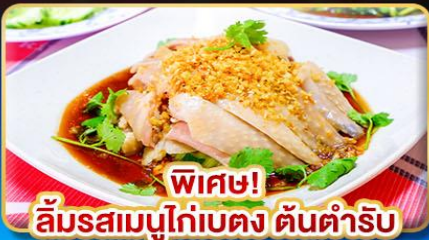
พิเศษ! ลิ้มรสเมนูไก่เบตง ต้นตำรับ