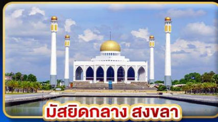
มัสยิดกลาง สงขลา