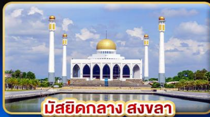
มัสยิดกลาง สงขลา