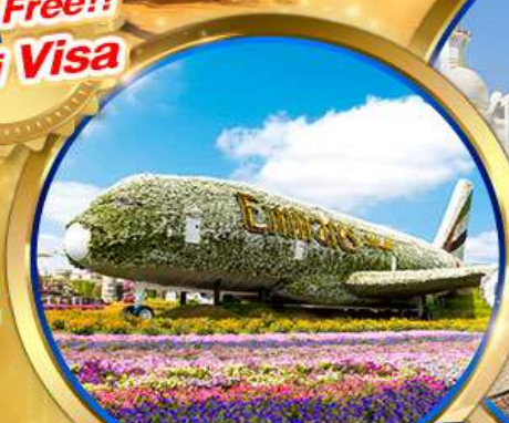
DUBAI MIRACLE GARDEN