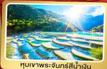
หุบเขาพระจันทร์สีน้ำเงิน