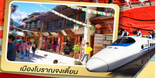
เมืองโบราณจงเตี้ยน