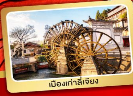
เมืองเก๋าลี่เจียง