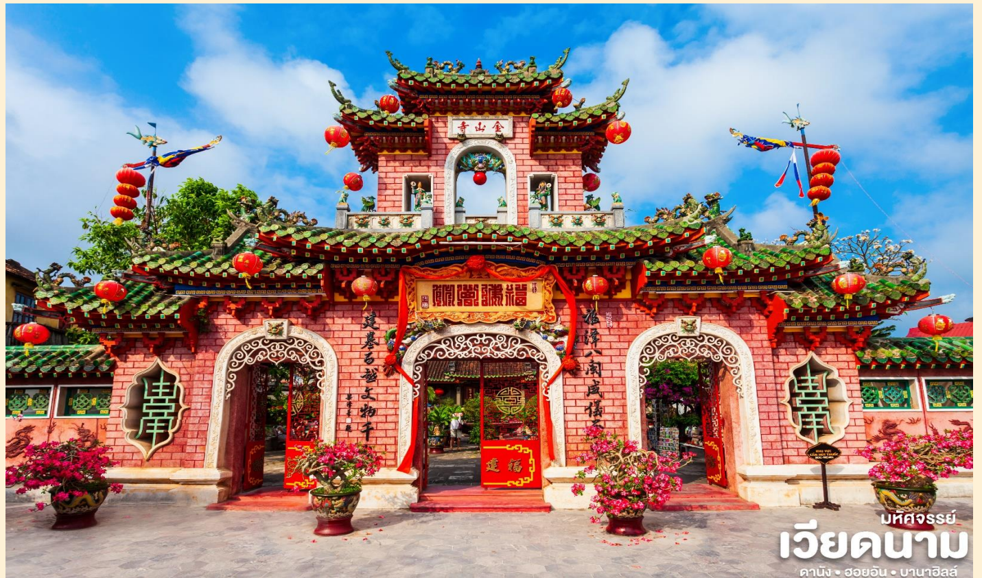
บห์คจรรย์ เวียดนาม ดานัง • ฮอยอัน • บานาอีลี

นำท่านชม วัดจีน เป็นสมาคมชาวจีนที่ใหญ่และเก่าแก่ที่สุดของเมืองฮอยอันใช้เป็นที่พบปะของคนหลายรุ่น วัดนี้มีจุดเด่นอยู่ที่งานไม้แกะสลักกลดลายสวยงามท่าน สามารถทำบุญต่ออายุโดยพิธีสมัยโบราณ คือ การนำรูปที่ขุดเป็นก้นหอย มาจุดทิ้งไว้เพื่อ เป็นสิริมงคลแก่ท่าน