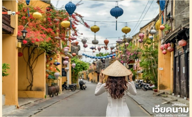
บห์คจรรย์ เวียดนาม ดานัง • ฮอยอัน • บานาอีลี

เมืองฮอยอันนั้นอดีตเคยเป็นเมืองท่า การค้าที่สำคัญแห่งหนึ่งในเอเชียตะวันออกเฉียงใต้และเป็นศูนย์กลางของการ แลกเปลี่ยนวัฒนธรรมระหว่างตะวันตกกับตะวันออกองค์การยูเนสโกได้ประกาศให้ฮอยอันเป็นเมืองมรดกโลกทางวัฒนธรรมเนื่องจากเป็นสถานที่สำคัญทางประวัติศาสตร์ แม้ว่าจะผ่านการบูรณะขึ้นเรื่อยๆแต่ก็ยังคงรูปแบบของเมืองฮอยอันไว้ได้