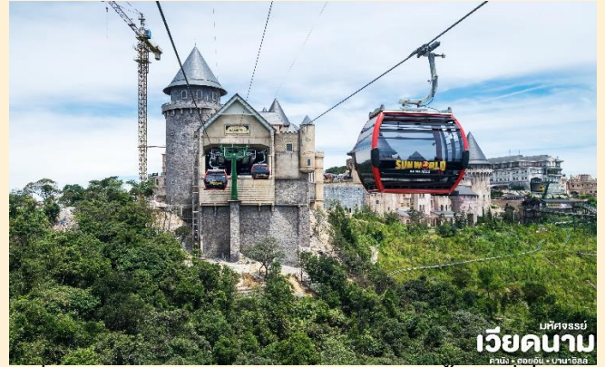
เม็คจรรย เวียดนาม ดานัง • ฮอยอัน • บานาฮิลล์

นำท่าน นั่งกระเช้าขึ้นสู่บานาฮิลล์ กระเช้าแห่งบานาฮิลล์นี้ได้รับการบันทึกสถิติโลกโดย World Record ว่าเป็นกระเช้าไฟฟ้าที่ยาวที่สุด ประเภท Non Stop โดยไม่หยุดแวะ มีความยาวทั้งสิ้น 5,042 เมตร และเป็นกระเช้าที่สูงที่สุด 1,294 เมตร นักท่องเที่ยวจะได้สัมผัสสลุยเมฆหมอกและบางจุดมีเมฆลอยต่ำกว่ากระเช้าพร้อมอากาศบริสุทธิ์อันสดชื่นจนทำให้ท่านอาจลืมไปเสียด้วยซ้ำว่าที่นี่ไม่ใช่ยุโรป เพราะอากาศที่หนาวเย็นเฉลี่ยตลอดทั้งปีประมาณ 10 องศาเท่านั้น