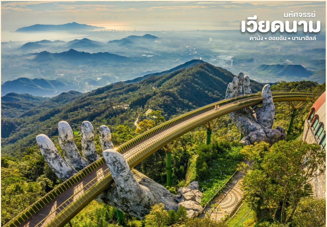
เม็คจรรย เวียดนาม ดานัง • ฮอยอัน • บานาฮิลล์

จากนั้นนำท่าน ชม สะพานสีทอง สถานที่ท่องเที่ยวใหม่ล่าสุดตั้งโดดเด่นเป็นเอกลักษณ์อย่างสวยงาม บนเขabanahill นำท่านสู่จุดที่สร้างความตื่นตะลึงให้นักท่องเที่ยวมองดูอย่างอลังการที่ซึ่งเต็มไปด้วยเสน่ห์แห่งตำนานและจินตนาการของการผจญภัยที่