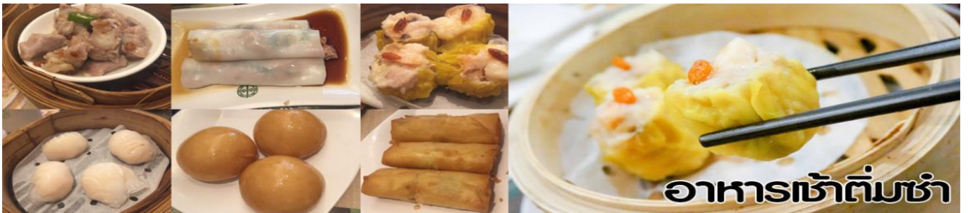
อาหารเช้าต้มซ่า

อิสระอาหารกลางวัน- อาหารเย็น ตามอัธยาศัย เพื่อสะดวกกับการช้อปปิ้ง