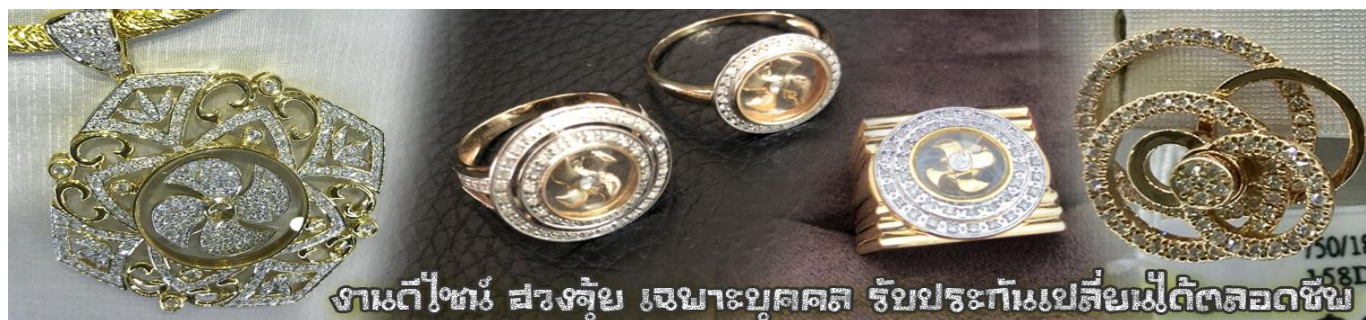
งานดีไซน์ สรวงจัญ เจษมาบุคคล รับประกันเปลี่ยนฟรีตลอดชีพ

นำท่านเยี่ยมชม โรงงานจิวเวลรี่ ที่ขึ้นชื่อของฮ่องกงพบกับงานดีไซน์ที่ได้รับรางวัลอันดับยอดเยี่ยม และใช้ในการเสริมดวงเรื่อง ธงจัญนำความโชคดี มั่งคั่งแก่ผู้สวมใส่ ซึ่งในเมืองไทยก็ได้นิยมแพร่หลายออกไป ไม่ว่าจะเป็นกลุ่ม ดารา นักการเมือง พ่อค้าแม่ขายที่ประกอบธุรกิจ เจ้าของกิจการห้างร้านต่างๆ ซึ่งเชื่อกันว่าจะนำสิ่งดี ๆ ปัดเป่าสิ่งชั่วร้ายให้กับบุคคลที่สวมใส่ ซึ่งจะมีมากมายหลายชนิด เช่น จี้กั้งหัน แหวนรุ่งต่าง ๆ นาฬิกาข้อมือ (ซึ่งผู้สวมใส่จะได้รับการดูอายุมือจากซินเซประจําร้าน เพื่อแนะนำวิธีการเสริมดวงในการสวมใส่โดยไม่ติดค่าบริการ)