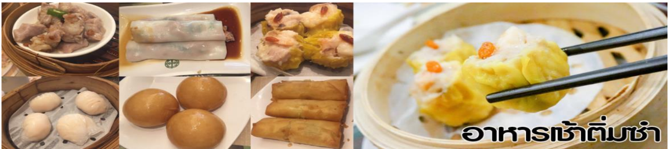
อาหารเช้าต้มซ่า