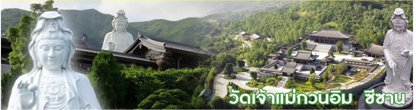
วัดเจ้าแม่กวนอิม ชีซาน

วัดชีซาน หลายคนที่เคยไปเที่ยวฮ่องกงมาแล้ว อาจจะยังไม่เคยเยือนวัดชีซาน หรือ Tsz Shan Monastery เป็นวัดที่มีเจ้าแม่กวนอิมองค์ใหญ่เป็นอันดับสองของโลก มีความสูงถึง 76 เมตร ตั้งอยู่บนเนื้อที่กว่า 29 ไร่ ในเกาะฮ่องกง โดยมีนาย ลีกาซิง มหาเศรษฐีชื่อดังของฮ่องกง บริจาคเงินสร้างวัดถึง 193 ล้านดอลลาร์เลยทีเดียว