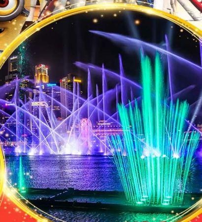
Light & Water Show