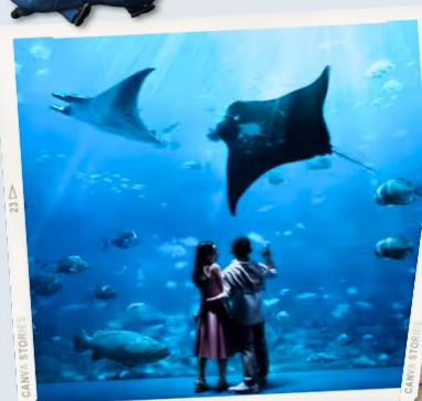
ZONE 7 : FAR FAR AWAY