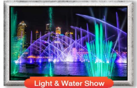
Light & Water Show