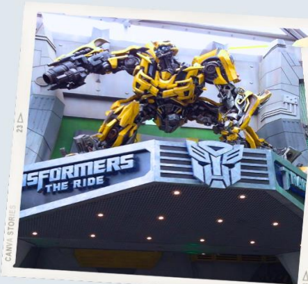
ZONE 1 : HOLLYWOOD