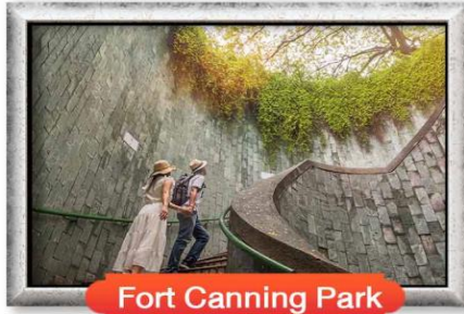
Fort Canning Park