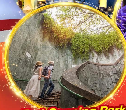
Fort Canning Park