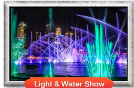
Light & Water Show