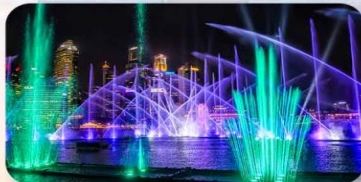
Light & Water Show