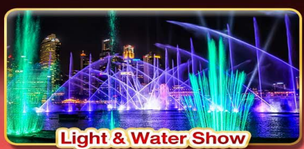
Light & Water Show