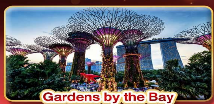
Gardens by the Bay