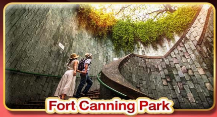
Fort Canning Park