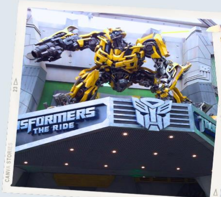
ZONE 1 : HOLLYWOOD