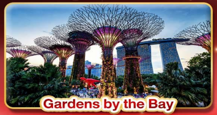
Gardens by the Bay