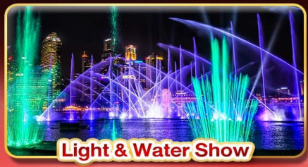
Light & Water Show