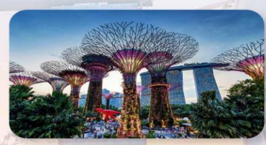
Gardens by the Bay