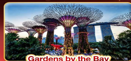
Gardens by the Bay