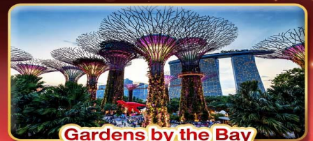
Gardens by the Bay