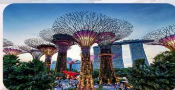
Gardens by the Bay