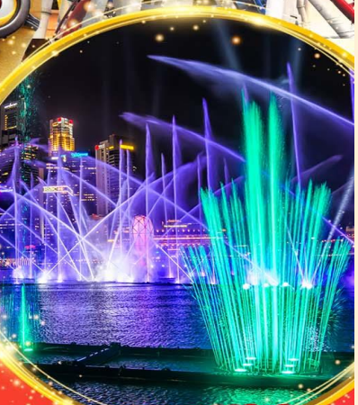
Light & Water Show