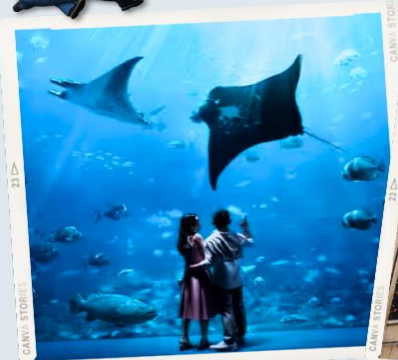
ZONE 7 : FAR FAR AWAY