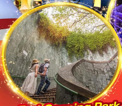
Fort Canning Park