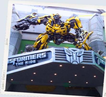
ZONE 1 : HOLLYWOOD