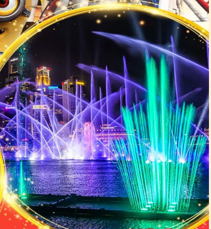
Light & Water Show