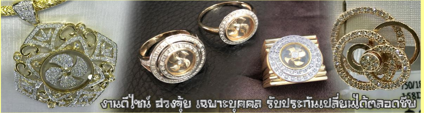
งานดีไซน์ สวยล้ำ เฉพาะบุคคล รับประกันเปลี่ยนเม็ดดีตลอดชีพ

นำท่านเยี่ยมชม โรงงานจิวเวลรี่ ที่ขึ้นชื่อของฮ่องกงพบกับงานดีไซน์ที่ได้รับรางวัลอันดับยอดเยี่ยม และใช้ในการเสริมดวงเรื่อง ฮวงจุ้ยนำความโชคดี มั่งคั่งแก่ผู้สวมใส่ ซึ่งในเมืองไทยก็ได้นิยมแพร่หลายออกไป ไม่ว่าจะเป็นกลุ่ม ดารา นักการเมือง พ่อค้าแม่ขายที่ประกอบธุรกิจ เจ้าของกิจการห้างร้านต่าง ๆ ซึ่งเชื่อกันว่าจะนำสิ่งดี ๆ บัดเป่าสิ่งชั่วร้ายให้กับบุคคลที่สวมใส่ ซึ่งจะมีมากมายหลายชนิด เช่น จี้กั๊กหั้น แหวนรุ่นต่าง ๆ นาฬิกาข้อมือ (ซึ่งผู้สวมใส่จะได้รับการดูลายมือจากซินเซปประจำร้าน เพื่อนำวิธีการเสริมดวงในการสวมใส่โดยไม่ติดต่อบริการ)