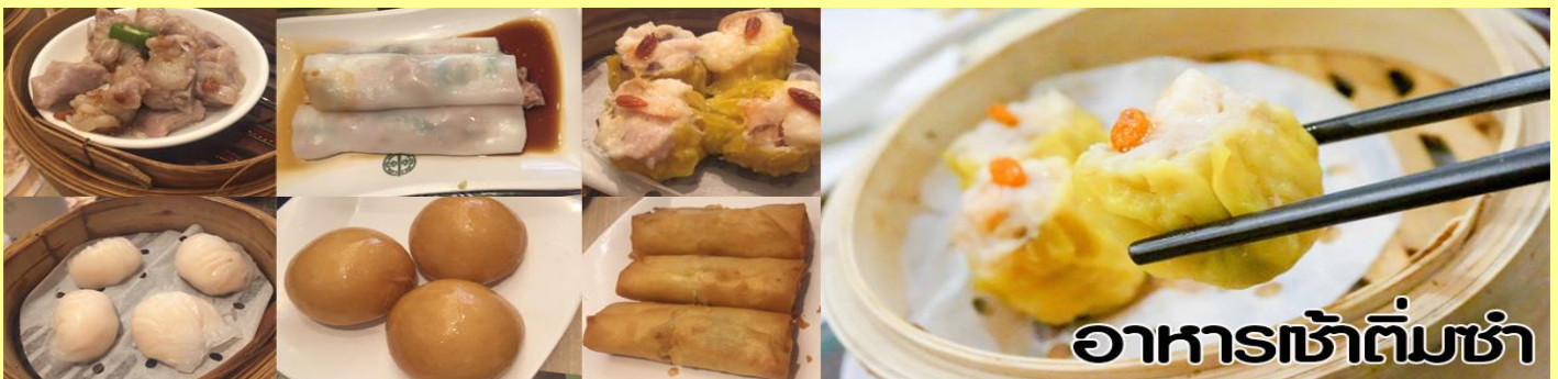
อาหารเช้าติ่มซำ