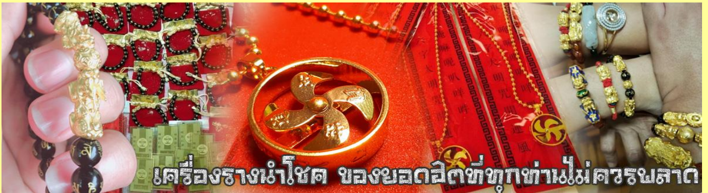
เครื่องรางนำโชค ของยอดเยี่ยมที่ทุกท่านไม่ควรพลาด

จากนั้นนำท่านสู่ ร้านหยก ชมความงามปีเซียะ ที่เชื่อกันว่าเป็นวัตถุมงคลยอดเยี่ยม ที่มีการนำมาบูชา เพื่อให้ช่วยป้องกันสิ่งชั่วร้าย เรียกทรัพย์สินเงินทองให้ไหลมาเทมา และกักเก็บทรัพย์นั้นไม่ให้รั่วไหลออกไปไหนได้ ชาวจีนโบราณเชื่อกันว่า ปีเซียะเป็นสัตว์ประหลาดที่รวมลักษณะของสัตว์มงคลทั้ง 5 ชนิดไว้ด้วยกัน ได้แก่ มังกร พญาราชสีห์หรือสิงโต, อินทรี, กวาง, และแมว โดยตามตำนานเล่าว่า ปีเซียะเป็นลูกมังกรตัวที่ 9 (เทพแห่งโชคลาภ) ของพญามังกรสวรรค์ มีชื่อเรียกด้วยกันหลายชื่อไม่ว่าจะเป็น “เทียนลก (กวางสวรรค์)” เป็นชื่อเดิม ส่วนจีนกวางตุ้งจะเรียกว่า “เผ่ย่า” และคนจีนแต้จิ๋วจะเรียกว่า “ผีซิว”