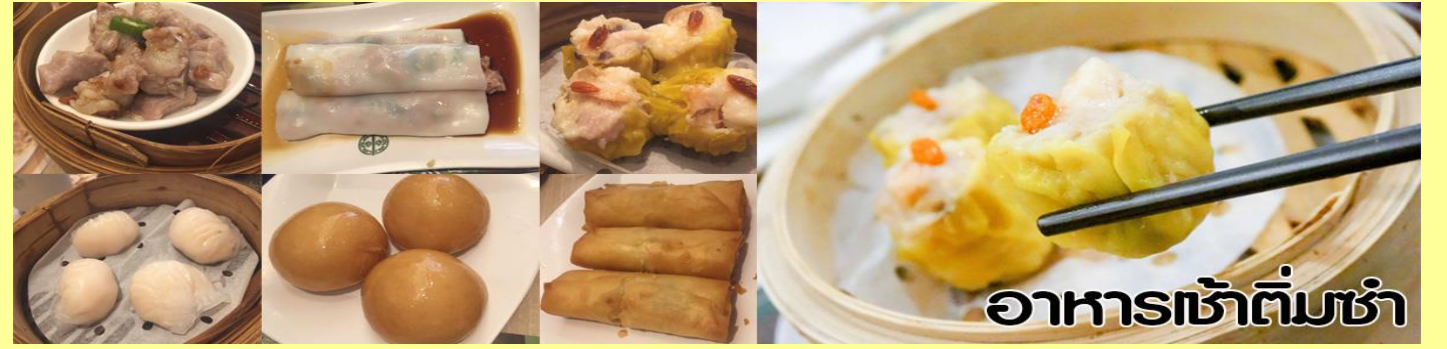
อาหารเช้าต้มซ่า

วันที่สอง แยกองค์เก่าแก่ (ไช่กง) - เจ้าแม่กวนอิมฮิมเงินสงอำ - ร้านจิวเวลรี่, ร้านหยก - วัดแชกง - ท้องต้าเซียน - ช้อปปิ้งนาหาร เช้า รับประทานอาหารเช้า (ต้มซ่า)