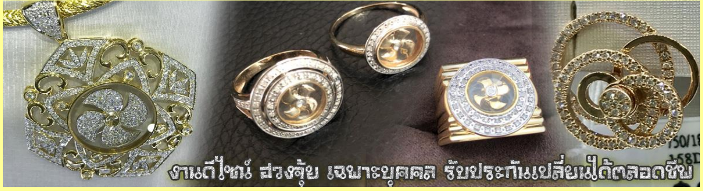
งานดีไซน์ สวยล้ำ เฉพาะบุคคล รับประกันเปลี่ยนเม็ดดีตลอดชีพ

นำท่านเยี่ยมชม โรงงานจิวเวลรี่ ที่ขึ้นชื่อของฮ่องกงพบกับงานดีไซน์ที่ได้รับรางวัลอันดับยอดเยี่ยม และใช้ในการเสริมดวงเรื่อง ฮวงจุ้ยนำความโชคดี มั่งคั่งแก่ผู้สวมใส่ ซึ่งในเมืองไทยก็ได้นิยมแพร่หลายออกไป ไม่ว่าจะเป็นกลุ่ม ดารา นักการเมือง พ่อค้าแม่ขายที่ประกอบธุรกิจ เจ้าของกิจการห้างร้านต่าง ๆ ซึ่งเชื่อกันว่าจะนำสิ่งดี ๆ ปัดเป่าสิ่งชั่วร้ายให้กับบุคคลที่สวมใส่ ซึ่งจะมีมากมายหลายชนิด เช่นจี้กั๊กหับ แหวนรุ่นต่าง ๆ นาฬิกาข้อมือ (ซึ่งผู้สวมใส่จะได้รับการดูลายมือจากซินเซปประจำร้าน เพื่อนำวิธีการเสริมดวงในการสวมใส่โดยไม่ติดค่าบริการ)