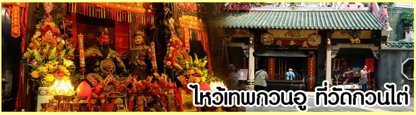
ไหว้เทพกวนอู ที่วัดกวนไต่

หลังจากนั้นขอพรเทพเจ้ากวนอู ณ วัดกวนไต่ วัดเก่าแก่สร้างขึ้นในปีพ.ศ. 2434 เป็นวัดเดียวในเกาลูนที่บูชาเทพ เจ้ากวนอูเป็นเทพผู้ยิ่งใหญ่ เทพเจ้าแห่งความซื่อสัตย์ โชคลาภ บารมี