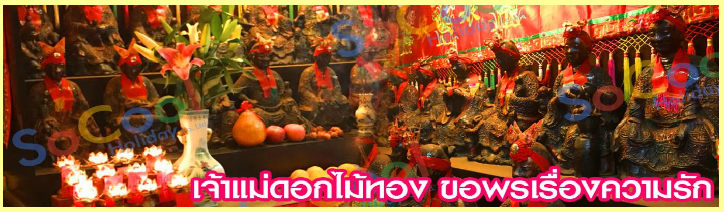
เจ้าแม่ดอกไม้ทอง ขอพรเรื่องความรัก