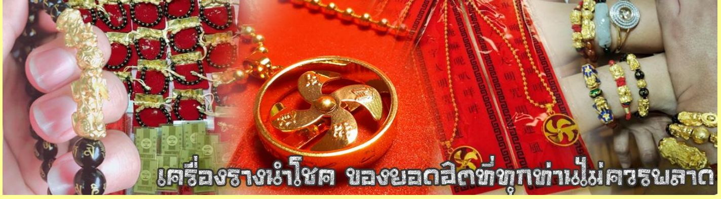
เครื่องรางนำโชค ของยอดฮิตที่ทุกท่านไม่ควรพลาด

จากนั้นนำท่านสู่ ร้านหยก ชมความงามปีเซียะ ที่เชื่อกันว่าเป็นวัตถุมงคลยอดเยี่ยม ที่มีการนำมาบูชา เพื่อให้ช่วยป้องกันสิ่งชั่วร้าย เรียกทรัพย์สินเงินทองให้ไหลมาเทมา และกักเก็บทรัพย์นั้นไม่ให้รั่วไหลออกไปไหนได้ ชาวจีนโบราณเชื่อกันว่า ปีเซียะเป็นสัตว์ประหลาดที่รวมลักษณะของสัตว์มงคลทั้ง 5 ชนิดไว้ด้วยกัน ได้แก่ มังกร พญาราชสีห์หรือสิงโต, อินทรี, กวาง, และแมว โดยตามตำนานเล่าว่า ปีเซียะเป็นลูกมังกรตัวที่ 9 (เทพแห่งโชคลาภ) ของพญามังกรสวรรค์ มีชื่อเรียกด้วยกันหลายชื่อไม่ว่าจะเป็น “เทียนลก (กวางสวรรค์)” เป็นชื่อเดิม ส่วนจีนกวางตุ้งจะเรียกว่า “เผ่ย่า” และคนจีนแต้จิ๋วจะเรียกว่า “ผีซิว”