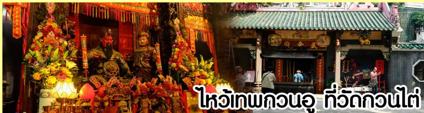
ไหว้เทพกวนอู ที่วัดกวนไต่

หลังจากนั้นขอพรเทพเจ้ากวนอู ณ วัดกวนไต่ วัดเก่าแก่สร้างขึ้นในปีพ.ศ. 2434 เป็นวัดเดียวในเกาะลูนที่บูชาเทพ เจ้ากวนอูเป็นเทพผู้ยิ่งใหญ่ เทพเจ้าแห่งความซื่อสัตย์ โชคลาภ บารมี