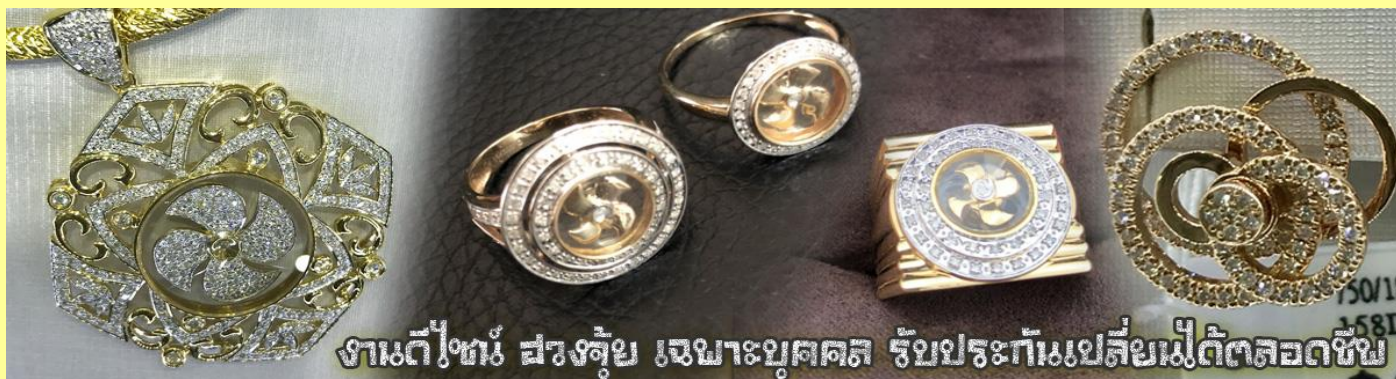
งานดีไซน์ สวยล้ำ เฉพาะบุคคล รับประกันเปลี่ยนเม็ดดีตลอดชีพ

นำท่านเยี่ยมชม โรงงานจิวเวลรี่ ที่ขึ้นชื่อของฮ่องกงพบกับงานดีไซน์ที่ได้รับรางวัลอันดับยอดเยี่ยม และใช้ในการเสริมดวงเรื่อง ฮวงจุ้ยนำความโชคดี มั่งคั่งแก่ผู้สวมใส่ ซึ่งในเมืองไทยก็ได้นิยมแพร่หลายออกไป ไม่ว่าจะเป็นกลุ่ม ดารา นักการเมือง พ่อค้าแม่ขายที่ประกอบธุรกิจ เจ้าของกิจการห้างร้านต่าง ๆ ซึ่งเชื่อกันว่าจะนำสิ่งดี ๆ ปัดเป่าสิ่งชั่วร้ายให้กับบุคคลที่สวมใส่ ซึ่งจะมีมากมายหลายชนิด เช่นจี้กั๊ก หุ่น รถมอเตอร์ต่าง ๆ นาฬิกาข้อมือ (ซึ่งผู้สวมใส่จะได้รับการดูลายมือจากซินเซปประจำร้าน เพื่อนำวิธีการเสริมดวงในการสวมใส่โดยไม่ติดต่อบริการ)