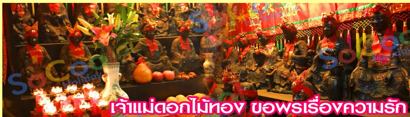
เจ้าแม่ดอกไม้สีทอง ขอพรเรื่องความรัก