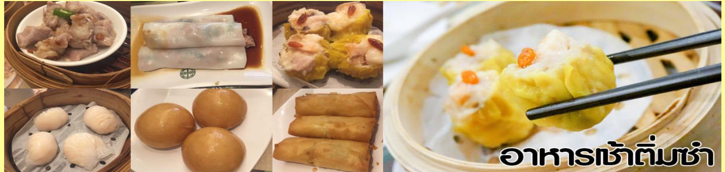
อาหารเช้าติ่มซำ