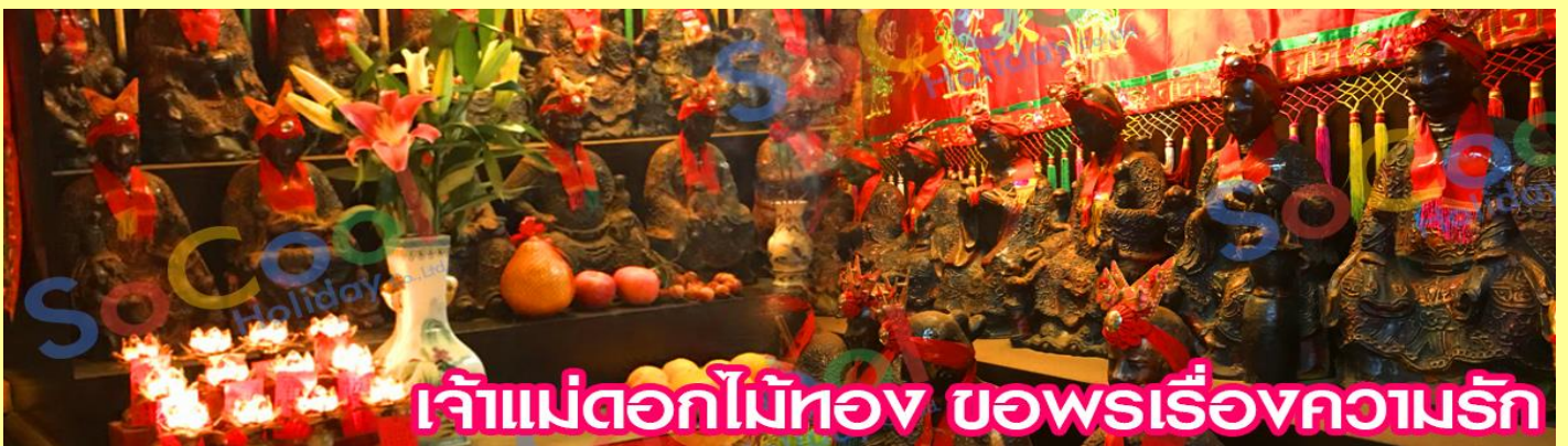
เจ้าแม่ดอกไม้สีทอง ขอพรเรื่องความรัก