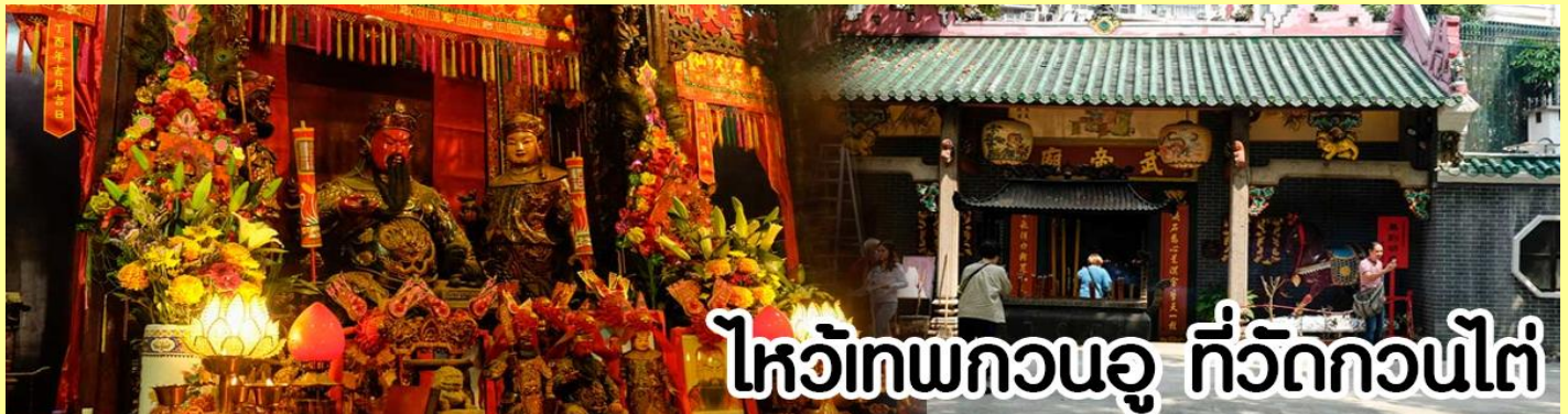
ไหว้เทพกวนอู ที่วัดกวนไต่

หลังจากนั้นขอพรเทพเจ้ากวนอู ณ วัดกวนไต่ วัดเก่าแก่สร้างขึ้นในปีพ.ศ. 2434 เป็นวัดเดียวในเกาะลุนที่บูชาเทพ เจ้ากวนอูเป็นเทพผู้ยิ่งใหญ่ เทพเจ้าแห่งความซื่อสัตย์ โชคลาภ บารมี