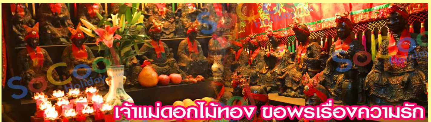
เจ้าแม่ดอกไม้สีทอง ขอพรเรื่องความรัก