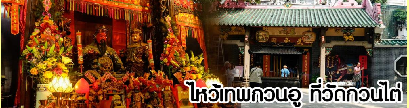
ไหว้เทพกวนอู ที่วัดกวนไต่

หลังจากนั้นขอพรเทพเจ้ากวนอู ณ วัดกวนไต่ วัดเก่าแก่สร้างขึ้นในปีพ.ศ. 2434 เป็นวัดเดียวในเกาะลุนที่บูชาเทพ เจ้ากวนอูเป็นเทพผู้ยิ่งใหญ่ เทพเจ้าแห่งความซื่อสัตย์ โชคลาภ บารมี