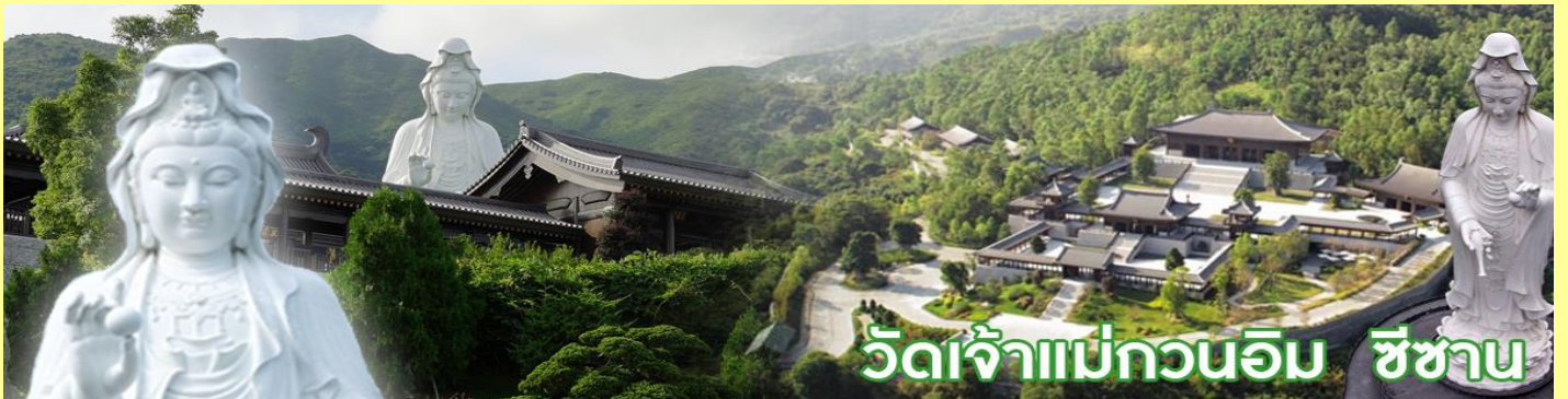
วัดเจ้าแม่กวนอิม ชีซาน

วัดชีซาน หลายคนที่เคยไปเที่ยวฮ่องกงมาแล้ว อาจจะยังไม่เคยเยือนวัดชีซาน หรือ Tsz Shan Monastery เป็นวัดที่มีเจ้าแม่กวนอิมองค์ใหญ่เป็นอันดับสองของโลก มีความสูงถึง 76 เมตร ตั้งอยู่บนเนื้อที่กว่า 29 ไร่ ในเกาะฮ่องกง โดยมีนาย ลีกาซิง มหาเศรษฐีชื่อดังของฮ่องกง บริจาคเงินสร้างวัดถึง 193 ล้านดอลลาร์เลยทีเดียว