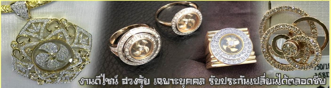
งานดีไซน์ สวยล้ำ เหมาะบุคคส รับประทันเป็สิยเม็ดตลอดซึช

นำท่านเยี่ยมชม โรงงานจิวเวลรี่ ที่ขึ้นชื่อของฮ่องกงพบกับงานดีไซน์ที่ได้รับรางวัลอันดับยอดเยี่ยม และใช้ในการเสริมดวงเรื่อง ฮวงจุ้ยนำความโชคดี มั่งคั่งแก่ผู้สวมใส่ ซึ่งในเมืองไทยก็ได้นิยมแพร่หลายออกไป ไม่ว่าจะเป็นกลุ่ม ดารา นักการเมือง พ่อค้าแม่ขายที่ประกอบธุรกิจ เจ้าของกิจการห้างร้านต่าง ๆ ซึ่งเชื่อกันว่าจะนำสิ่งดี ๆ บัดเป่าสิ่งชั่วร้ายให้กับบุคคลที่สวมใส่ ซึ่งจะมีมากมายหลายชนิด เช่น จี้กำหับ แหวนรุ่นต่าง ๆ นาฬิกาข้อมือ (ซึ่งผู้สวมใส่จะได้รับการดูลายมือจากซินเซปประจำร้าน เพื่อนำวิธีการเสริมดวงในการสวมใส่โดยไม่ติดต่อบริการ)