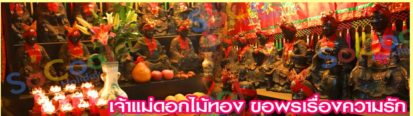
เจ้าแม่ดอกไม้ทอง ขอพรเรื่องความรัก