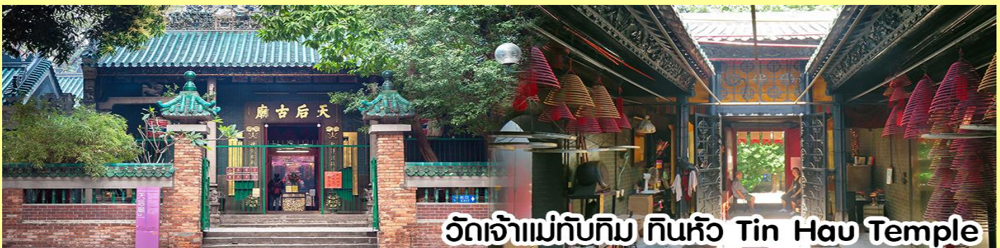
วัดเจ้าแม่ทับทิม ทินหัว Tin Hau Temple

นำทุกท่าน ไหว้ศาลเจ้าแม่ทับทิม ทินหัว (Tin Hau Temple) เป็นวัดเก่าแก่และสำคัญอีกวัดหนึ่งของฮ่องกง เพราะในสมัยก่อนฮ่องกงเป็นเพียงหมู่บ้านชาวประมง ซึ่งเคารพนับถือเจ้าแม่ทับทิมว่าเป็นเทพีแห่งทะเล เพื่อให้เดินทางปลอดภัย เวลาออกไปทำงานไกล ๆ หรือออกหาปลา นอกจากการมาสักการะบูชาเจ้าแม่ทับทิมในเรื่องของการเดินทางให้ปลอดภัยแล้ว ไฮไลท์สำคัญอีกอย่างหนึ่งของ วัดเจ้าแม่ทับทิม ทินหัว (Tin Hau Temple) จะเป็นขบวนรูปปั้นขนาดใหญ่ ที่แขวนอยู่ตามเพดานด้านในวิหารของวัดเต็มไปหมด จะยิ่งสวยงามในยามที่มีแสงแดงส่องลงมาเหมือนเป็นลำแสงส่องทะลุวันรูปแปลกตายิ่งนัก ส่วนอาคารของวัดก็จะเป็นสถาปัตยกรรมแบบวัดจีน สร้างขึ้นตั้งแต่ปีค.ศ. 1876 โดยทางเข้าของวัดจะอยู่ติดกับสวนสาธารณะเล็กๆ ที่มีต้นไม้ใหญ่หลายต้น ให้บรรยากาศร่มรื่น