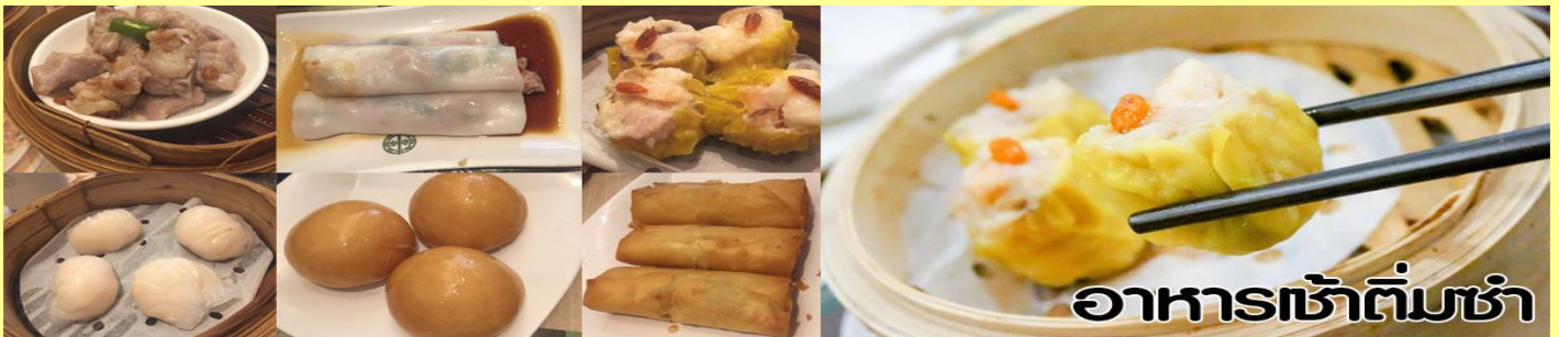
อาหารเช้าเต็มชาม

นำทุกท่าน ไหว้ศาลเจ้าแม่ทับทิม ทินหัว (Tin Hau Temple) เป็นวัดเก่าแก่และสำคัญอีกวัดหนึ่งของฮ่องกง เพราะในสมัยก่อนฮ่องกงเป็นเพียงหมู่บ้านชาวประมง ซึ่งเคารพนับถือเจ้าแม่ทับทิมว่าเป็นเทพีแห่งทะเล เพื่อให้เดินทางปลอดภัย เวลาออกไปทำงานไกล ๆ หรือออกหาปลา นอกจากการมาสักการะบูชาเจ้าแม่ทับทิมในเรื่องของการเดินทางให้ปลอดภัยแล้ว ไฮไลท์สำคัญอีกอย่างหนึ่งของ วัดเจ้าแม่ทับทิม ทินหัว (Tin Hau Temple) จะเป็นขบวนรูปปั้นขนาดใหญ่ ที่แขวนอยู่ตามเพดานด้านในวิหารของวัดเต็มไปหมด จะยิ่งสวยงามในยามที่มีแสงแดงส่องลงมาเหมือนเป็นลำแสงส่องทะลุวันรูปแปลกตายิ่งนัก ส่วนอาคารของวัดก็จะเป็นสถาปัตยกรรมแบบวัดจีน สร้างขึ้นตั้งแต่ปีค.ศ. 1876 โดยทางเข้าของวัดจะอยู่ติดกับสวนสาธารณะเล็กๆ ที่มีต้นไม้ใหญ่หลายต้น ให้บรรยากาศร่มรื่น