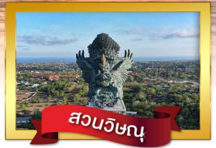
สวนวิษณุ