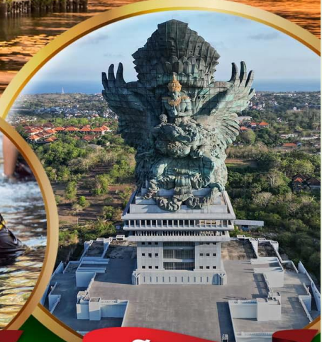
สวนวิษณุ