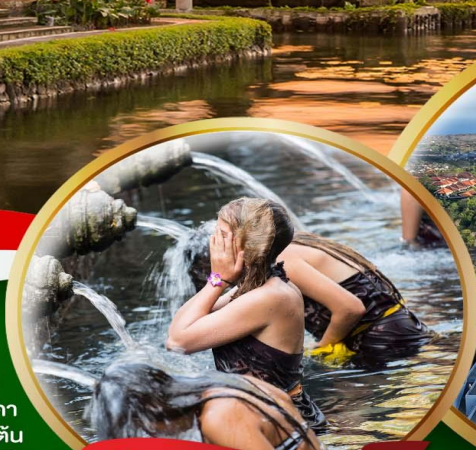
Pura Tirta Empul