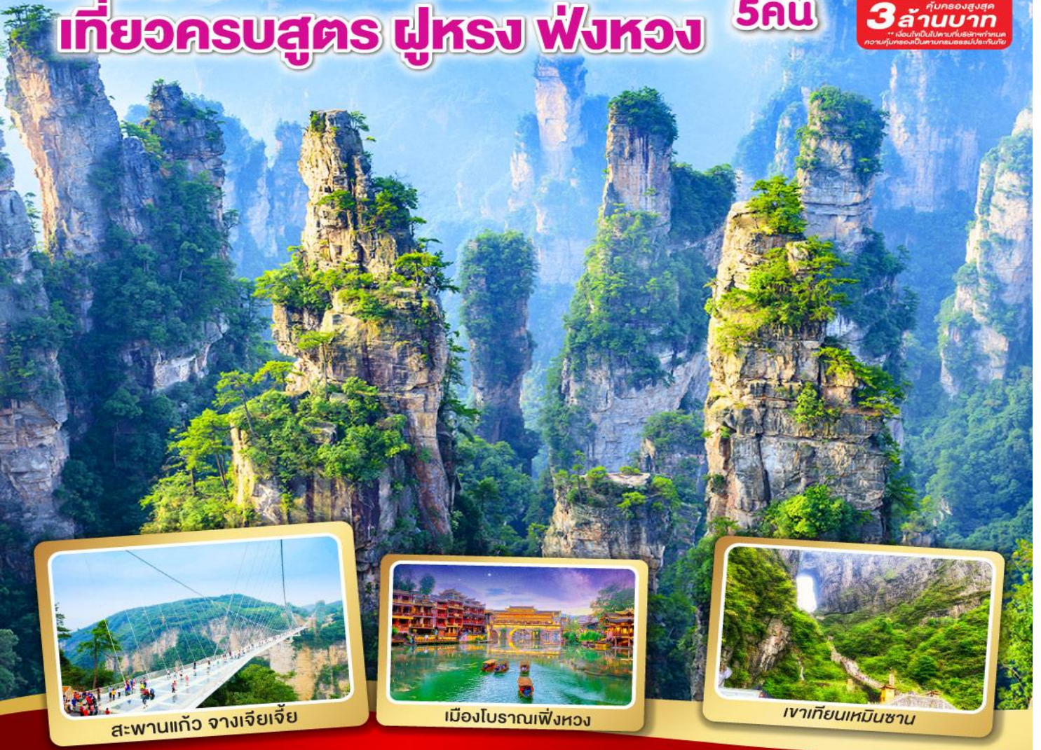
สะพานแกว่ง จางเจียเจีย