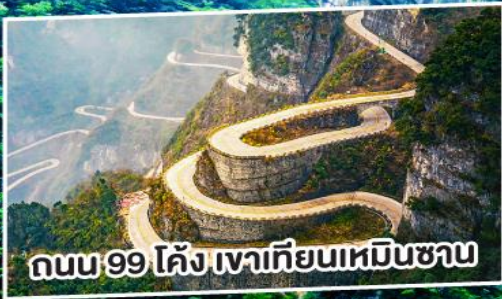
ถนน 99 โค้ง เหวเทียนเหมินซาน