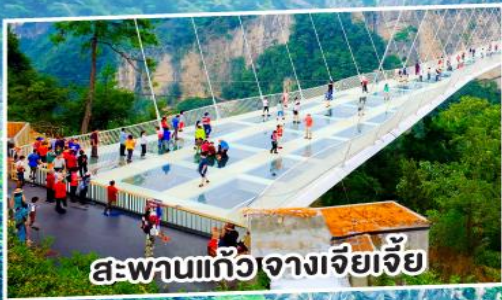
สะพานแก้วจางเจียเจีย

ฟรี ประกันสุขภาพ และอุบัติเหตุ คนไทยवलัน GTIP Plus (Gold Plan) 3 ล้านบาท คุ้มครองสูงสุด *เงื่อนไขมีข้อยกเว้น ตามที่กรมธรรม์ประกันภัย