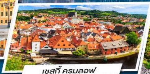
เซสท์ ครุมลอฟ