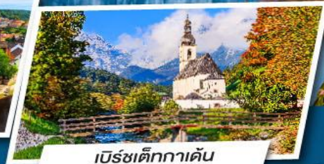
เบียร์เต็กกาเดิน