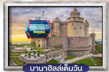
บานาฮิลล์เต็มวัน