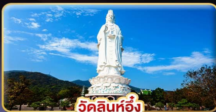
วัดลินห์ฮิ่ง

ล่องกระงายามค่ำคืนที่ “ฮอยอัน” เที่ยวบานาฮิลล์เต็มวัน