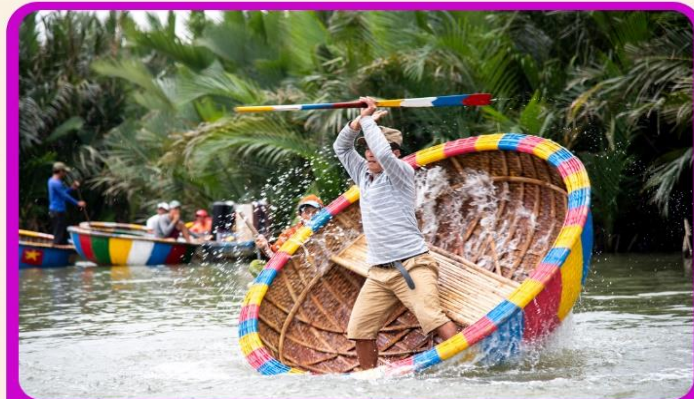
พิเศษ !!! นิ่งเรือกระดัง UNSEEN เวียดนาม