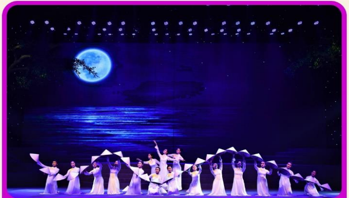
ชมการแสดง Charming Show Danang