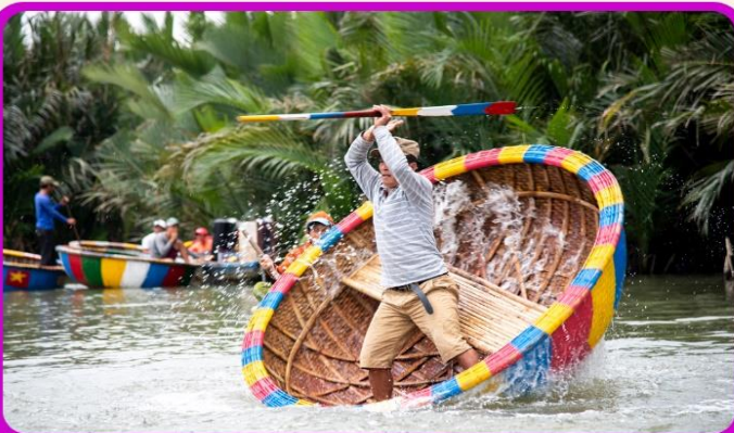
พิเศษ !!! นั่งเรือกระดัง UNSEEN เวียดนาม