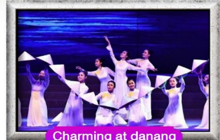
Charming at danang