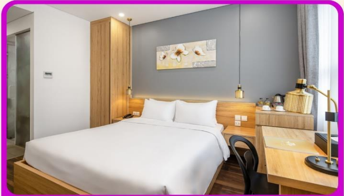
พักเมืองดานัง 4 ดาว 2 คืน