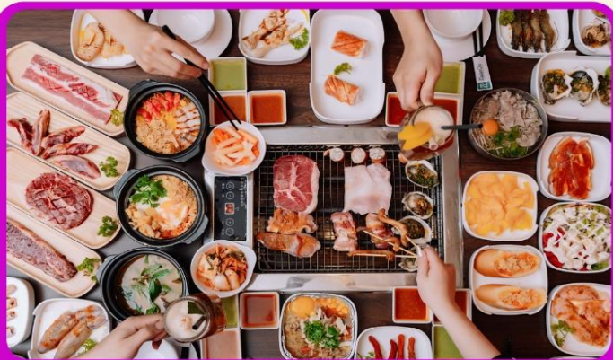
พิเศษ!! เมบูซาซิมิ+บุฟเฟ่ต์ปิ้งย่าง