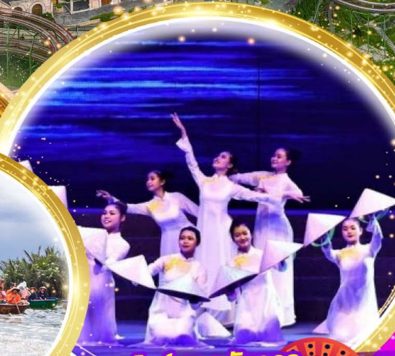
โชว์สุดอลังการ Charming at danang