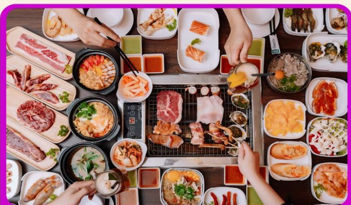
พิเศษ!! เมบูซาซิมิ+บุฟเฟ่ต์ปิ้งย่าง