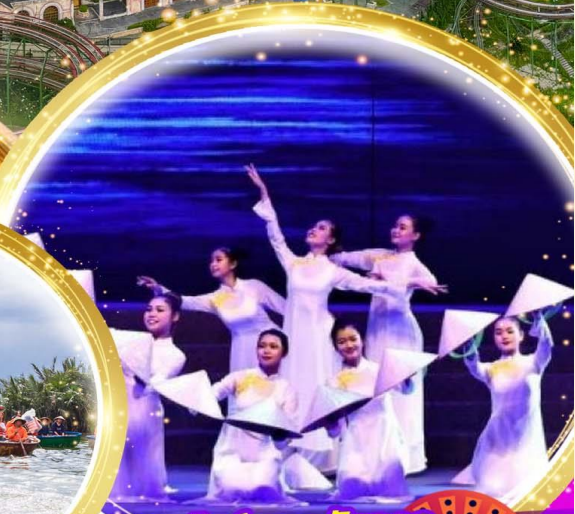
โชว์สุดอลังการ Charming at danang