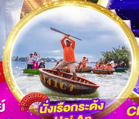
นั่งเรือกระด้ง Hoi An