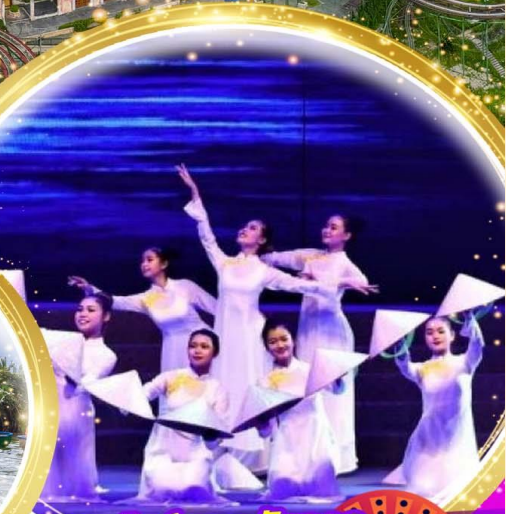
โชว์สุดอลังการ Charming at danang