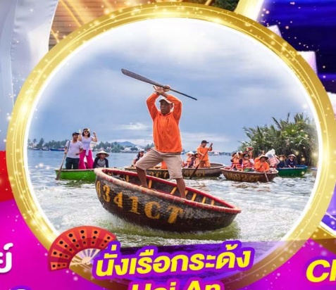
นั่งเรือกระด้ง Hoi An