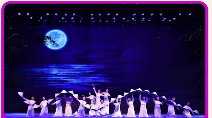
ชมการแสดง Charming Show Danang