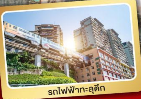
รถไฟฟ้าทะลุตึก