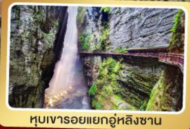
หุบเขารอยแยกอุ่หลิงซาน