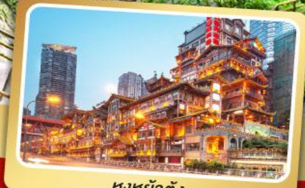
หงหย่าตั้ง