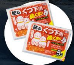
แผ่นความร้อนสำหรับ ให้ความอบอุ่นร่างกาย

2. บนเกาะโอลค์ฮอนจะมีอากาศหนาวมากต้องเตรียมกระติกน้ำเก็บความร้อนแบบพกพาได้ไปด้วย เพื่อต้มน้ำให้ความอบอุ่นร่างกาย