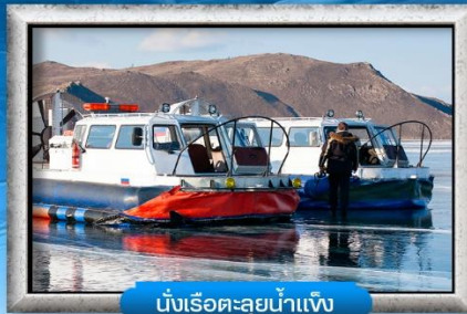
นั่งเรือทะลุน้ำแข็ง