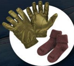
ถุงมือหนาบุขน ถุงเท้ากันหนาวแบบหนา