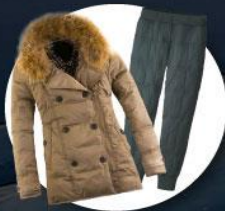
เสื้อและกางเกง กันหนาว, กันลม