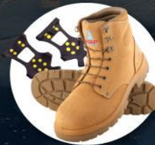
รองเท้าสำหรับเดินบนหิมะ น้ำแข็ง หรือติดก้นส้น Ice grippers