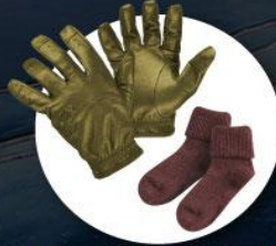
ถุงมือหนาบุขน ถุงเท้ากันหนาวแบบหนา