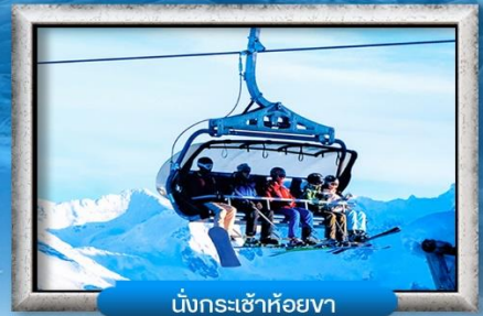
นั่งกระเช้าห้อยเขา