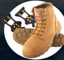
รองเท้าสำหรับเดินบนหิมะ น้ำแข็ง หรือติดก้นส้น Ice grippers