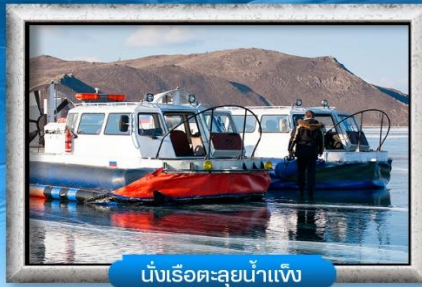
นั่งเรือทะเลสาบน้ำแข็ง