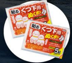
แผ่นความร้อนสำหรับ ให้ความอบอุ่นร่างกาย

2. บนเกาะโอลค์ฮอนจะมีอากาศหนาวมากต้องเตรียมกระติกน้ำเก็บความร้อนแบบพกพาได้ไปด้วย เพื่อต้มน้ำให้ความอบอุ่นร่างกาย