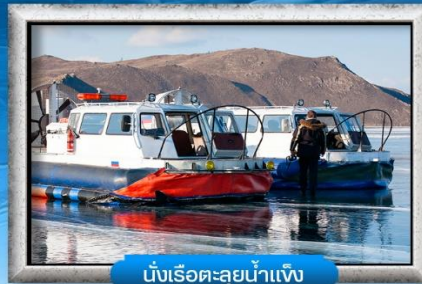
นั่งเรือทะเลลุยน้ำแข็ง