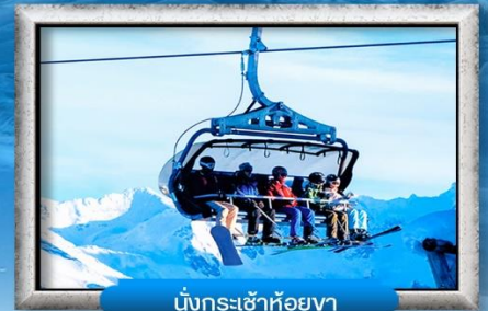
นั่งกระเช้าห้อยเขา