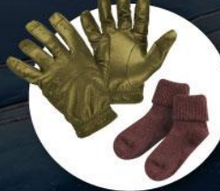
ถุงมือหนาบุขน ถุงเท้ากันหนาวแบบหนา