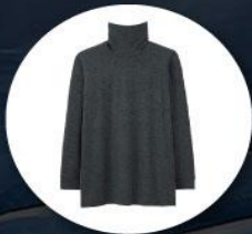
Heattech (ฮีทเทค) รูปแบบพิเศษ ทั้งกางเกงและเสื้อ

1. เสื้อผ้าควรเตรียมเสื้อผ้าสำหรับป้องกันความหนาวใช้ในอุณหภูมิต่ำสุด -40 องศาโดยประมาณ