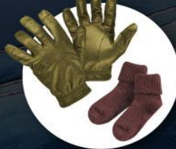
ถุงมือหนาบุขน ถุงเท้ากันหนาวแบบหนา