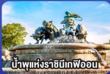
น้ำพุแห่งราชินีเทเฟออน