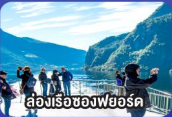
ล่องเรือชมความงามของฟยอร์ด