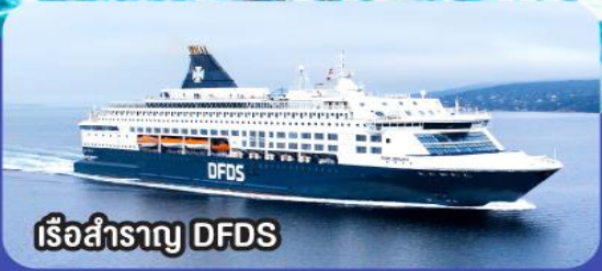
เรือสำราญ DFDS