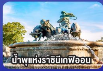
น้ำพุแห่งราชินีเทฟลอน