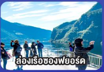
ล่องเรือช่องฟยอร์ด