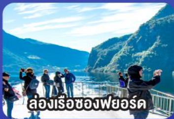
ล่องเรือชมความงามของฟยอร์ด